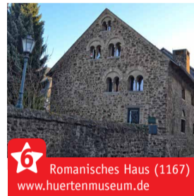
Romanisches Haus (1167) www.huertenmuseum.de