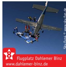
Flugplatz Dahlemer Binz www.dahlemer-binz.de