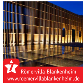
Römervilla Blankenheim www.roemervillablankenheim.de