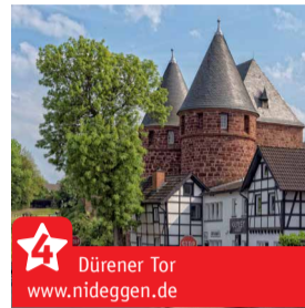
Dürener Tor www.nideggen.de