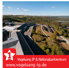
Vogelsang IP & Nationalparkzentrum www.vogelsang-ip.de

Nicht nur die historischen Stadt- & Ortskerne sind einen Besuch wert, auch einige weitere Highlights liegen an unserer Strecke und dort lohnt sich ein Stopp ebenfalls