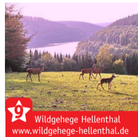
Wildgehege Hellenthal www.wildgehege-hellenthal.de