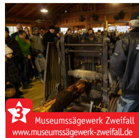
Museumssägewerk Zweifall www.museumssaegewerk-zweifall.de