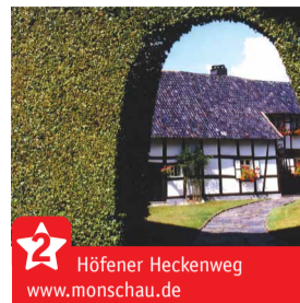
Höfener Heckenweg www.monschau.de